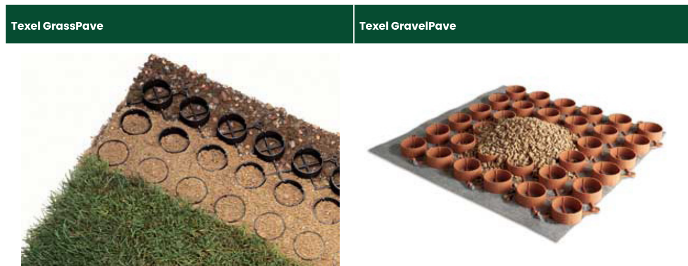
TABLEAU DES PRODUITS

Tout comme le Texel GrassPave, le Texel GravelPave assure le transfert des charges au sol de fondation. Le géotextile non-tissé fixé à la structure tridimensionnelle permet de contenir plus efficacement le gravier. En respectant les conditions de mise en place, le Texel GravelPave peut être garanti 25 ans.