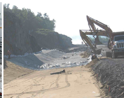
IMPERMÉABILISATION DE FOSSÉ

Les géomembranes thermoplastiques sont utilisées pour des applications tel que: